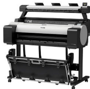
IMAGEPROGRAF TM-300 MFP L36Ei