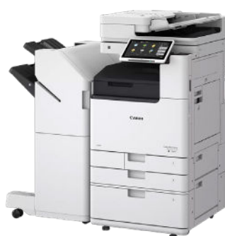
CANON IMAGERUNNER ADVANCE DX 4900