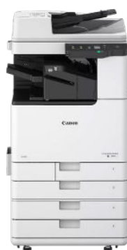
CANON SERIE IMAGERUNNER 2900