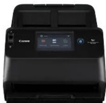
SCANNER DOCUMENT SCANNER DR-S150