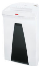
DISTRUGGI DOCUMENTI HSM SECURIO B24