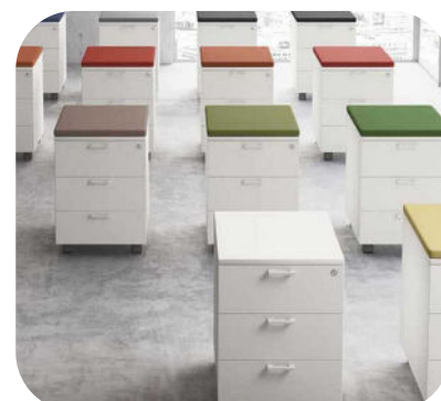
ARMADI E CONTENITORI