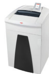
DISTRUGGI DOCUMENTI HSM SECURIO P401