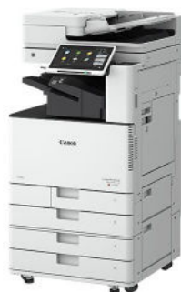
IMAGERUNNER ADVANCE DX C3922I