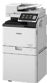
IMAGERUNNER ADVANCE DX C259I MFP