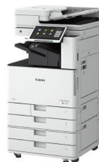
IMAGERUNNER ADVANCE DX C5840I MFP